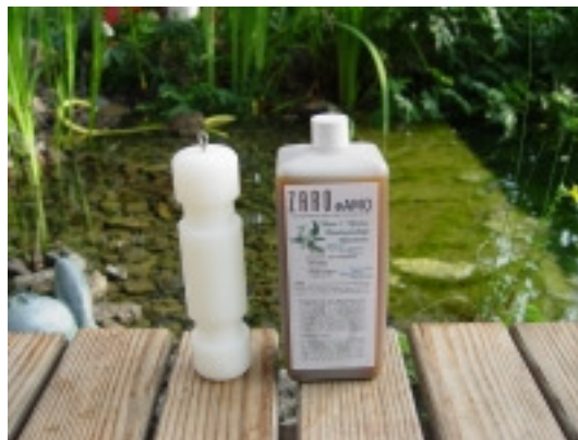
Kooperieren ideal bei der Beseitigung von Algen Und bei der biologischen Teichregenerierung !

Fordern Sie unsere Studien zum Thema Teiche an!